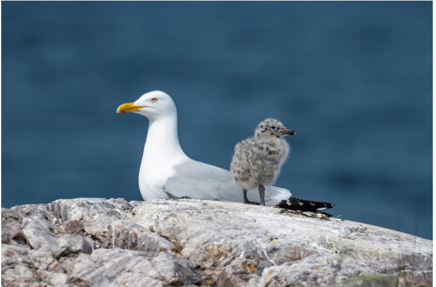
Herring Gull ( Larus argentatus ) with chick. // Goéland argenté avec son poussin.